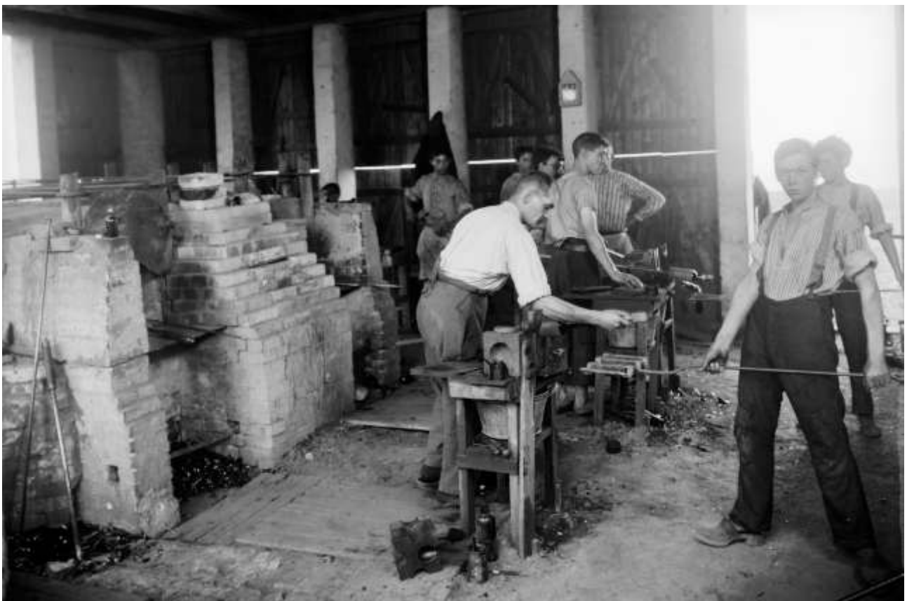
Interiør fra Esbjerg Glasværk