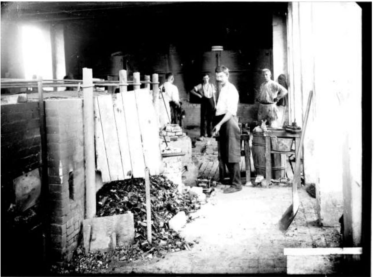
Interiør fra Esbjerg Glasværk: